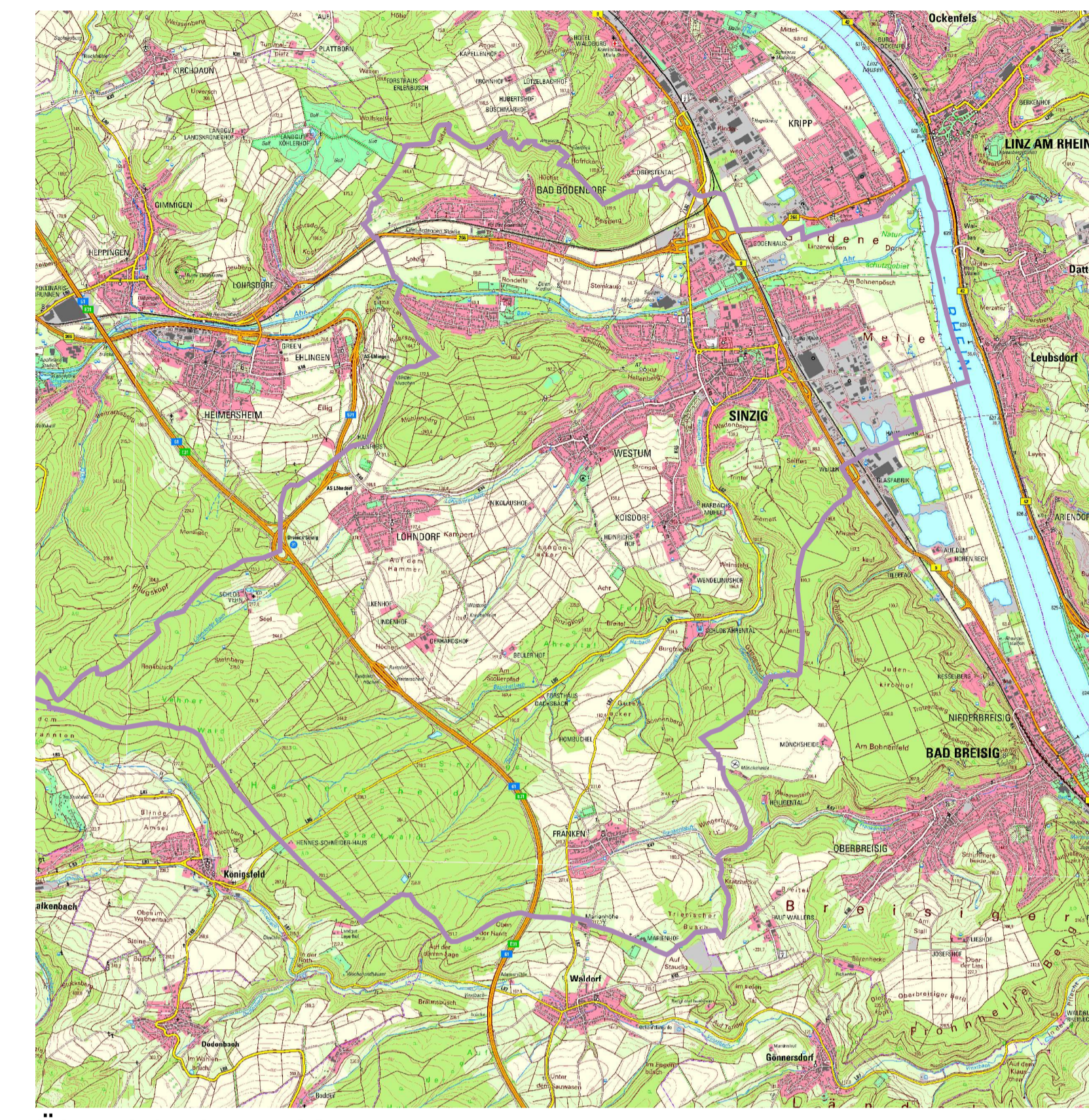
Übersichtskarte M 1:50000