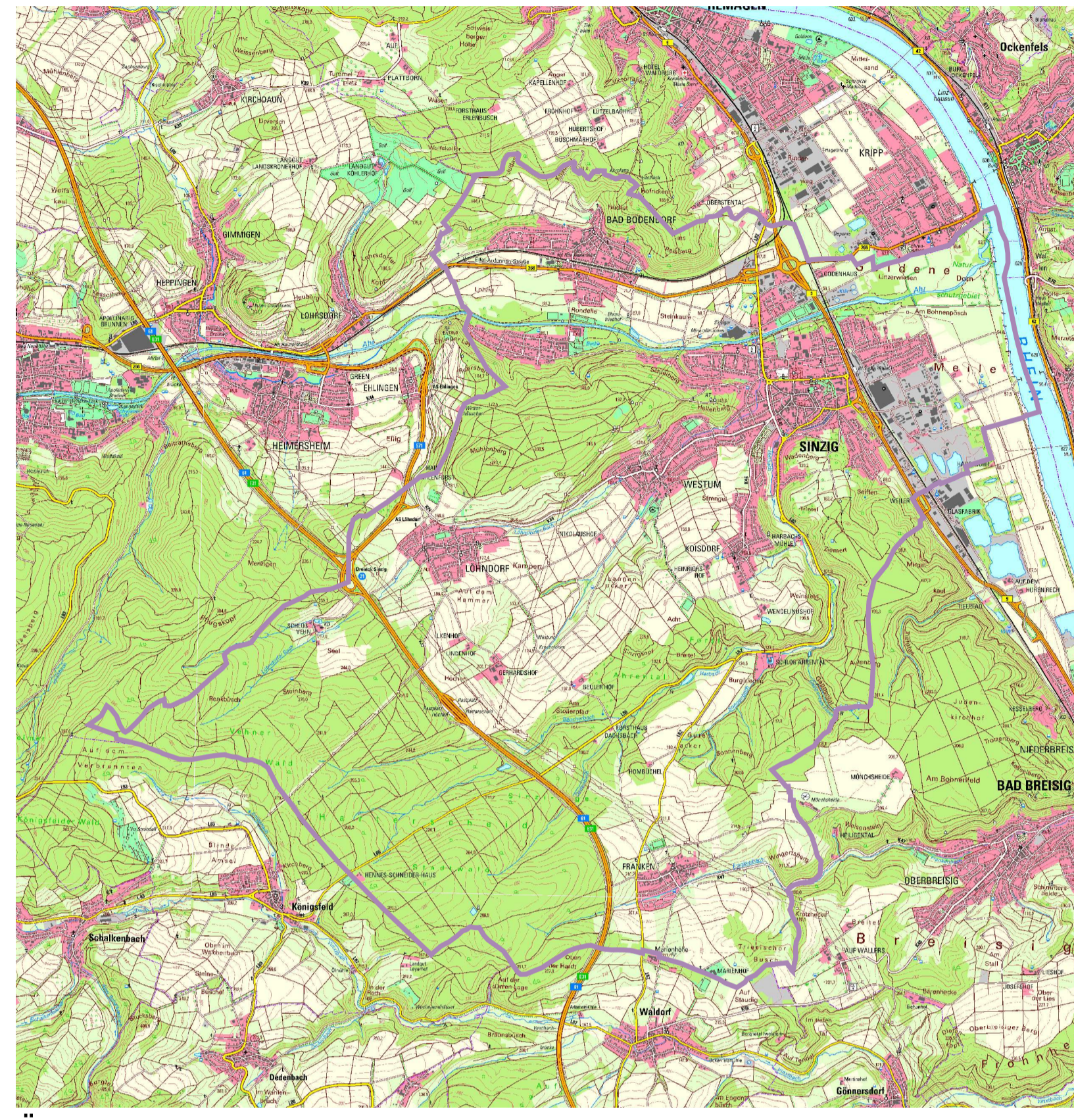
Übersichtskarte M 1:50000